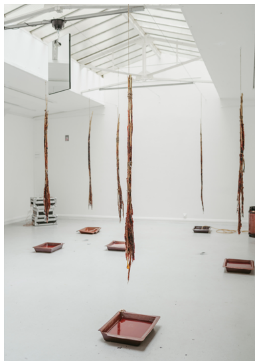
Shanna Warocquier, Sanguines Photographie © Eddy Pividor, PDAC 2024