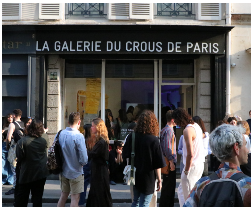
Galerie du Crous de Paris, Photographie © PDAC 2023

Les binômes prennent en charge le transport de leurs œuvres ainsi que le montage de l'exposition au sein de La Galerie du Crous de Paris (qui se fera avec l'aide de l'équipe de production du Prix). De même, ils s'engagent à récupérer leurs œuvres à la fin de l'exposition. Le montage se déroulera du 2 au 5 juin, avec l'appui du régisseur de La Galerie du Crous de Paris et des équipes de production du Prix Dauphine, dans le cadre d'une scénographie pensée par nos équipes. Le démontage se fera le 15 juin. Les binômes sélectionnés s'engagent à être présents le jour du vernissage et du finissage de l'exposition et seront conviés aux temps forts organisés tout au long de la durée de l'exposition.