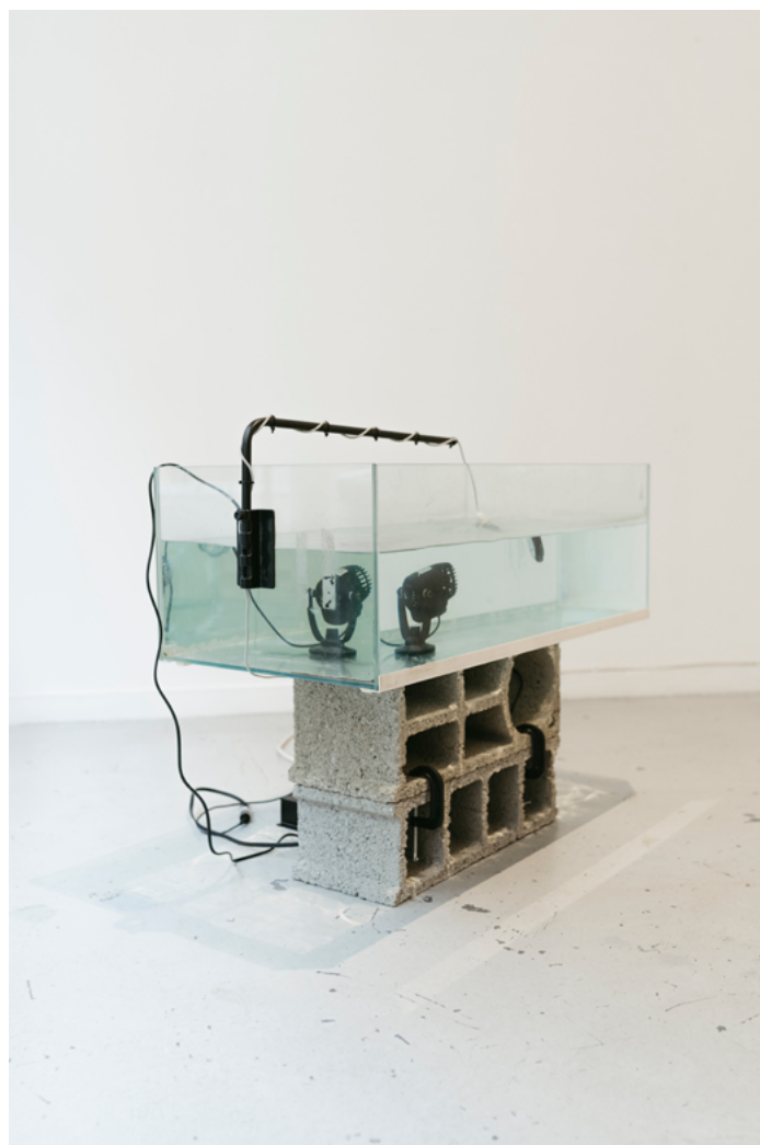
Photographie © I'M NOT DROWNING I'M WAITING IN THE WATER 2 Photographie © Eddy Pividor.jpg

Les prix du jury et le prix du public, d'une valeur respective de 2000€ et 1000€, seront remis lors de la journée de clôture de l'exposition, le 14 juin 2025.